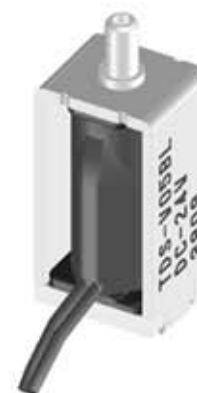
標準コイル表 連続定格 1.1W Standard Coil Specifications Cont. rating 1.1W